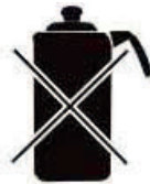
Чайник из алюминия и меди