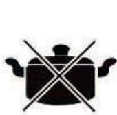
Кастрюля с округлым дном

Посуда из жаропрочного стекла, керамическая посуда, посуда из алюминия и меди, посуда с округлым дном диаметром менее 12 см.